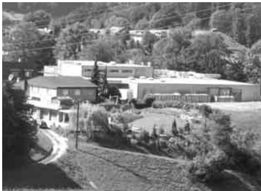
Le couvoir « Erb Brüterei AG » à Aeschlen (BE), qui lors d'une journée porte ouverte en août présentait ses installations totalement modernisées.