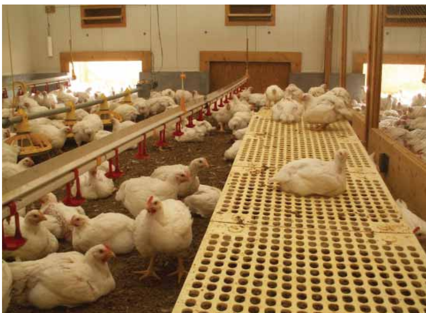
Photo: Vue dans l'un des deux poulaillers d'essai d'engraissement à Aviforum. Grâce à des aires à climat extérieur et des surfaces surélevées, des essais avec SST en conditions pratiques peuvent être effectués.