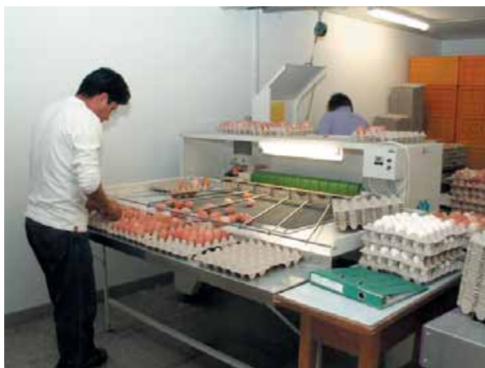
Photo: Aviforum commercialise ses produits comme chaque producteur d'œufs ou de volaille indépendant et connaît ainsi les exigences du marché.