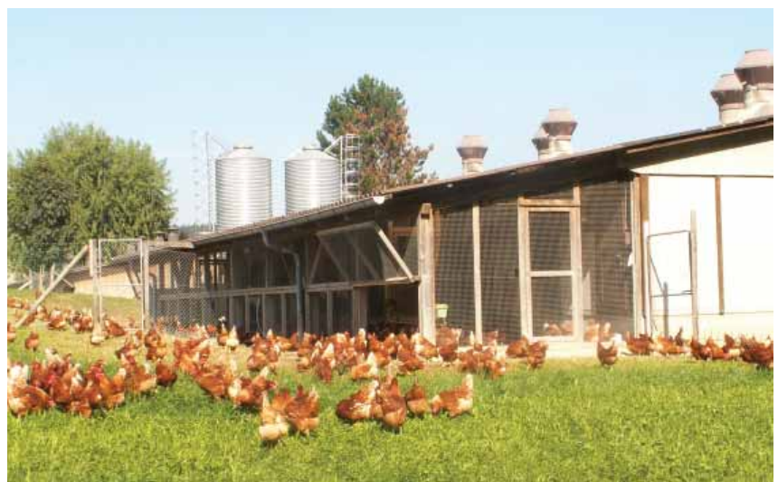
Photo: Le poulailler 2 d'Aviforum permet de faire des essais de ponte en liberté avec 8 groupes.

La pression de la productivité sur les surfaces et sur les animaux va augmenter. Un des défis majeurs des prochaines décennies va être d'accroître l'efficacité des ressources – d'avoir le plus possible de denrées alimentaires saines en utilisant le moins de ressources possibles et en les surchargeant le moins possible. A ce titre, la société attend que les animaux de rente soient traités de manière conforme aux besoins de l'espèce. Le bien-être de l'animal, sa santé, son comportement conforme aux besoins de l'espèce sont une condition préalable.