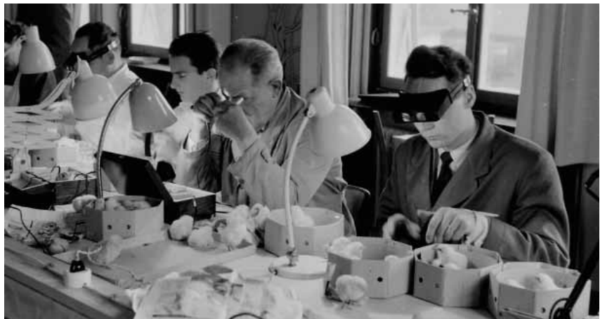
Photo: Lors du sexage des poussins durant les années cinquante.

Grâce à leur appui, il a été possible d'élargir de manière significative le partenariat. Aviforum les remercie vivement pour leur important soutien au niveau matériel, immatériel et financier.