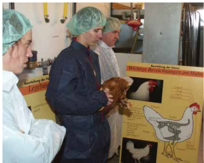
Photo: Dans le cadre du nouveau concept de la formation en agriculture, l'enseignement orienté vers l'action joue un rôle central. Aviforum prend cet objectif en considération.