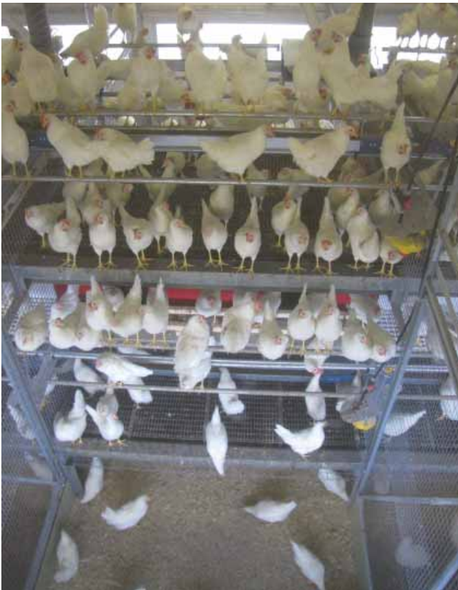
Photo: Vue à l'intérieur du nouveau poulailler d'essai de ponte à Aviforum avec la perspective des visiteurs, c'est-à-dire depuis le couloir surélevé destiné aux visiteurs.

L'ancien poulailler des poulets d'engraissement, que l'on pouvait subdiviser en de nombreux groupes, a toujours été précieux pour Aviforum en raison des nombreuses répétitions. C'est peut-être une des raisons qui a incité à se décider à jouer la carte de la recherche pour le nouveau poulailler des pondeuses également et de concevoir un poulailler moderne et proche du terrain, qui puisse ré-