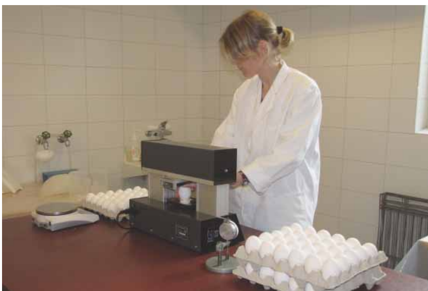
Photo: Mesure de la solidité de la coquille dans le cadre des essais de ponte à Aviforum.

Grâce à son très bon réseau de relations avec tous les partenaires de la