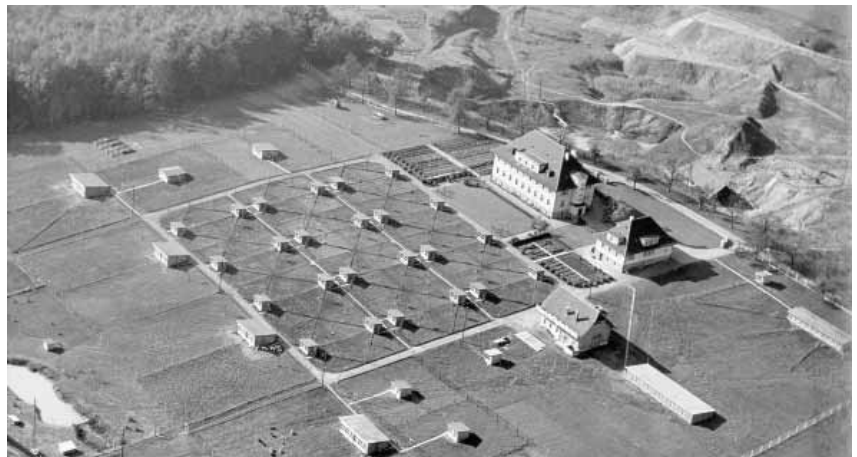
Photo: Le site d'Aviform peu après sa création vers 1936. Les petites maisons étaient destinées aux épreuves de performances. En arrière-plan, le site remblayé de la tuilerie de Worblaufen.