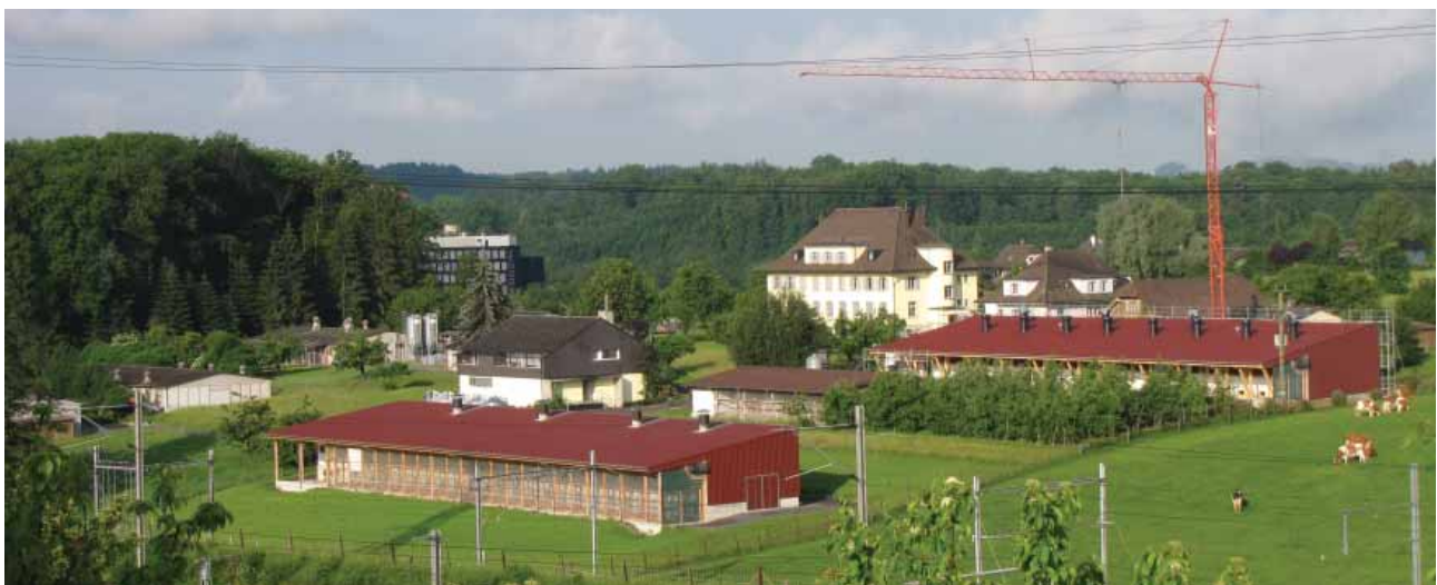
Photo: Une vue de l'Est sur le site d'Aviforum, au Sud-Est de Zollikofen (voir également le plan du site à la page 12).