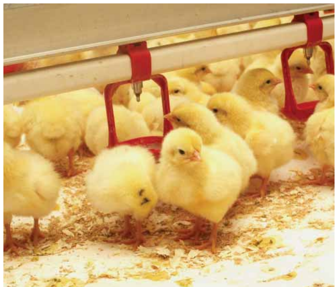
Photo: Des poussins sont mis en place dans les deux poulaillers d'essai d'engraissement toutes les huit semaines.