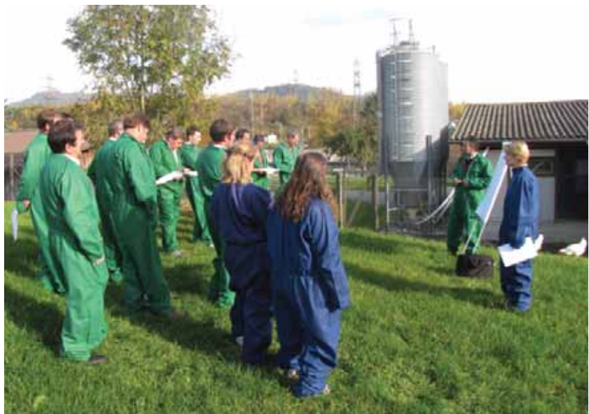
Photo: Cours de formation continue à Aviforum sur la gestion des sorties et les soins à la prairie.