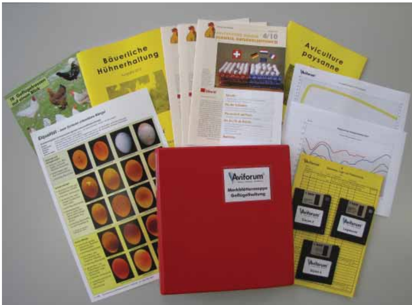
Photo: Aviforum fournit une large palette de publications et de supports d'enseignement à l'attention des détenteurs de volaille, des enseignants et des conseillers.

Andreas Gloor, Aviforum, responsable information/services ■