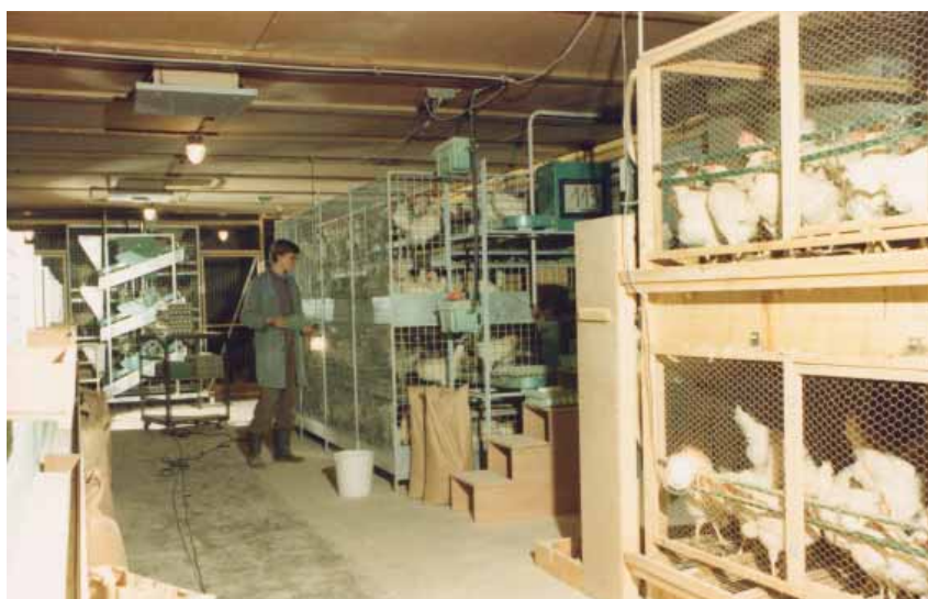
Photo: Au cours des années huitante, les différents systèmes alternatifs mis au point suite à l'interdiction des batteries en Suisse ont été testés chez Aviforum.